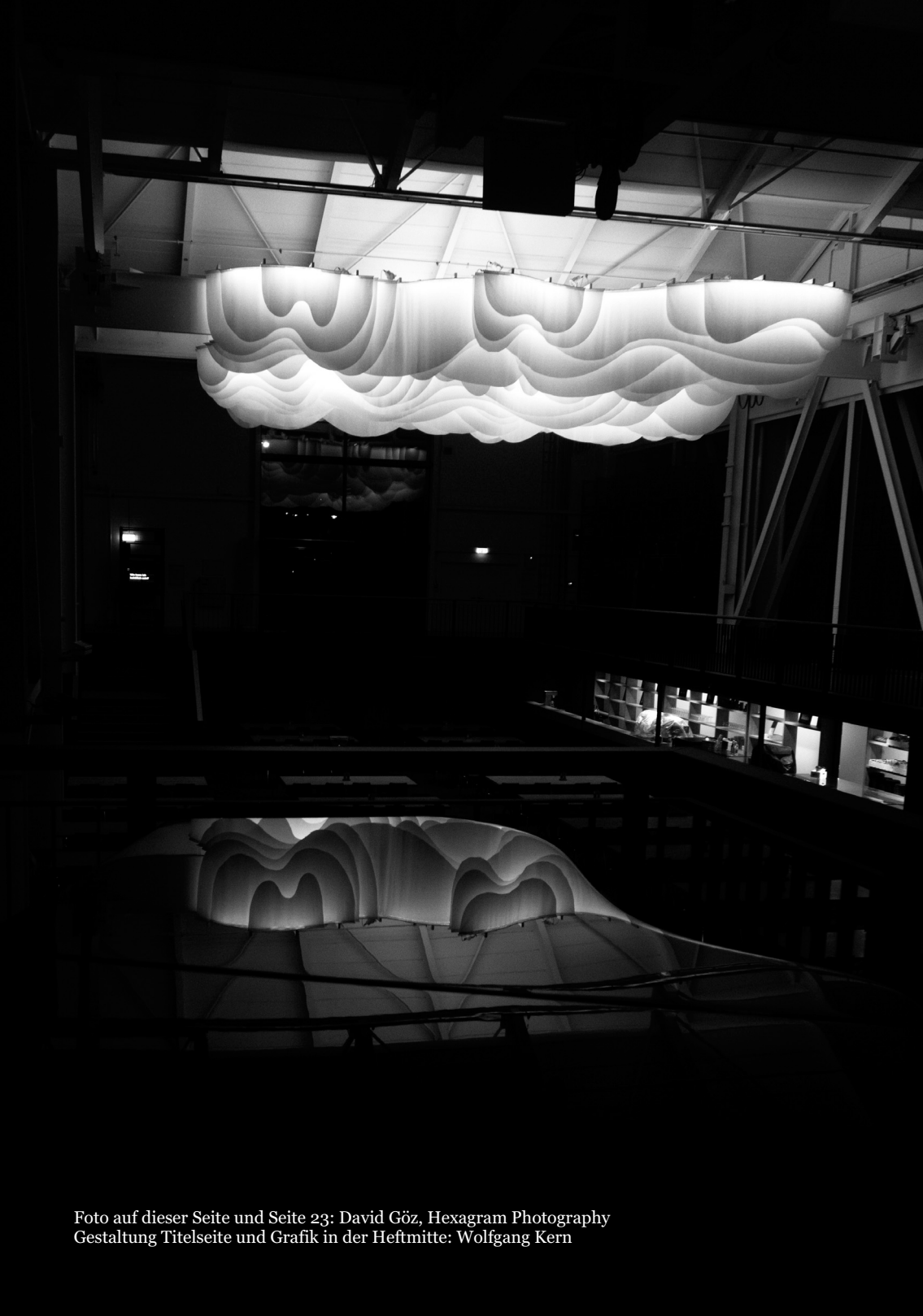
Gestaltung Titelseite und Grafik in der Heftmitte: Wolfgang Kern